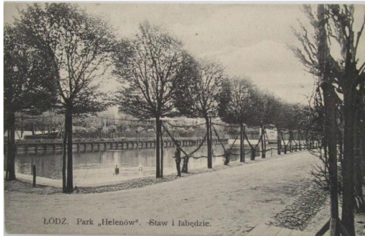
Staw w parku Helenów w Łodzi oraz reklama zabawy na lodzie z roku 1891.