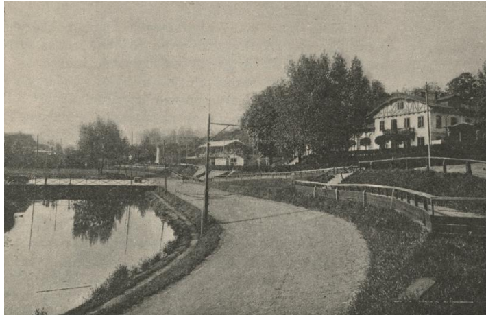
Siedziba WTC na Dynasach z torem wyścigowym w roku 1903.

W latach 90-tych XIX w. ślizgano się w Warszawie na czterech lodowiskach. Na wspomnianych Dynasach, dwóch stawach w Łazienkach, w Promenadzie i w Dolinie Szwajcarskiej. Dużą frekwencją cieszyła się ślizgawka, urządzana w cyrku na terenie Doliny. Skromniejszą była ślizgawka na stawie w Ogrodzie Saskim, którą w dzierżawie miało zazwyczaj Towarzystwo Wioślarskie lub Yacht-Klub.