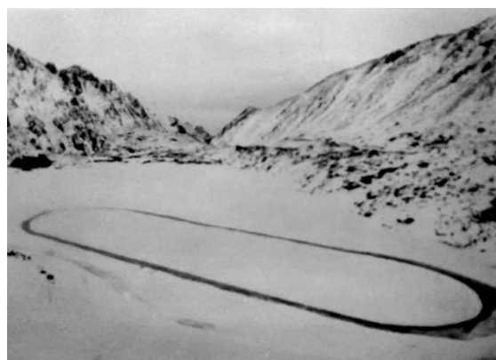
Trening łyżwiarzy na wysokogórskim stawie.

Po prawej tor łyżwiarski na Stawie Przednim w Dolinie Pięciu Stawów Polskich