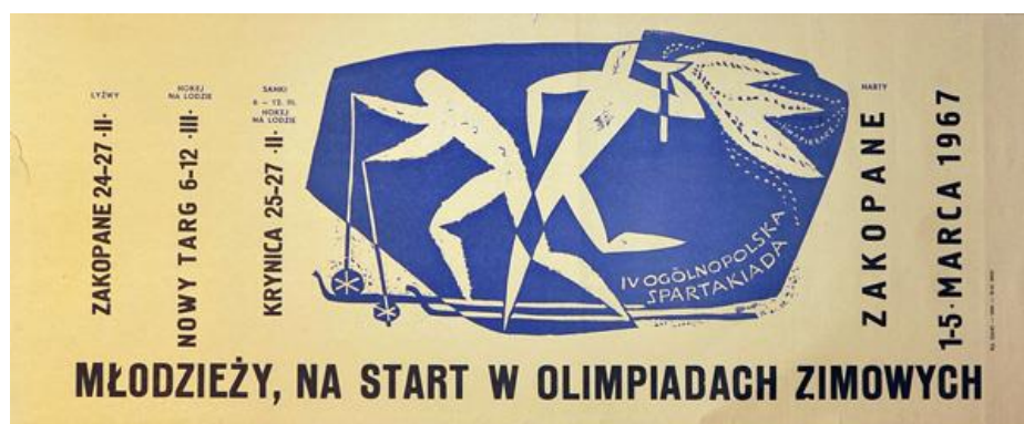
Plakat zapowiadający IV Ogólnopolską Spartakiadę w 1967 r.

Spotkała nas tam niestety bardzo nieprzyjemna niespodzianka. Temperatura spadła poniżej minus 35°C, a my mieliśmy tkane kombinezony, przepuszczające powietrze. Już przed startem na 500 m, kiedy przygotowania przeciągnęły się o kilka minut, w momencie strzału startera byłem jednym soptem lodu. Zawodnicy innych ekip albo mieli ubiory uszyte z innego materiału, albo ratowali się, wkładając pod kombinezon kilka warstw gazet! Nie zdaliśmy więc przedolimpijskiego egzaminu i o starcie w Igrzyskach w Grenoble w 1968 r. nie było mowy.